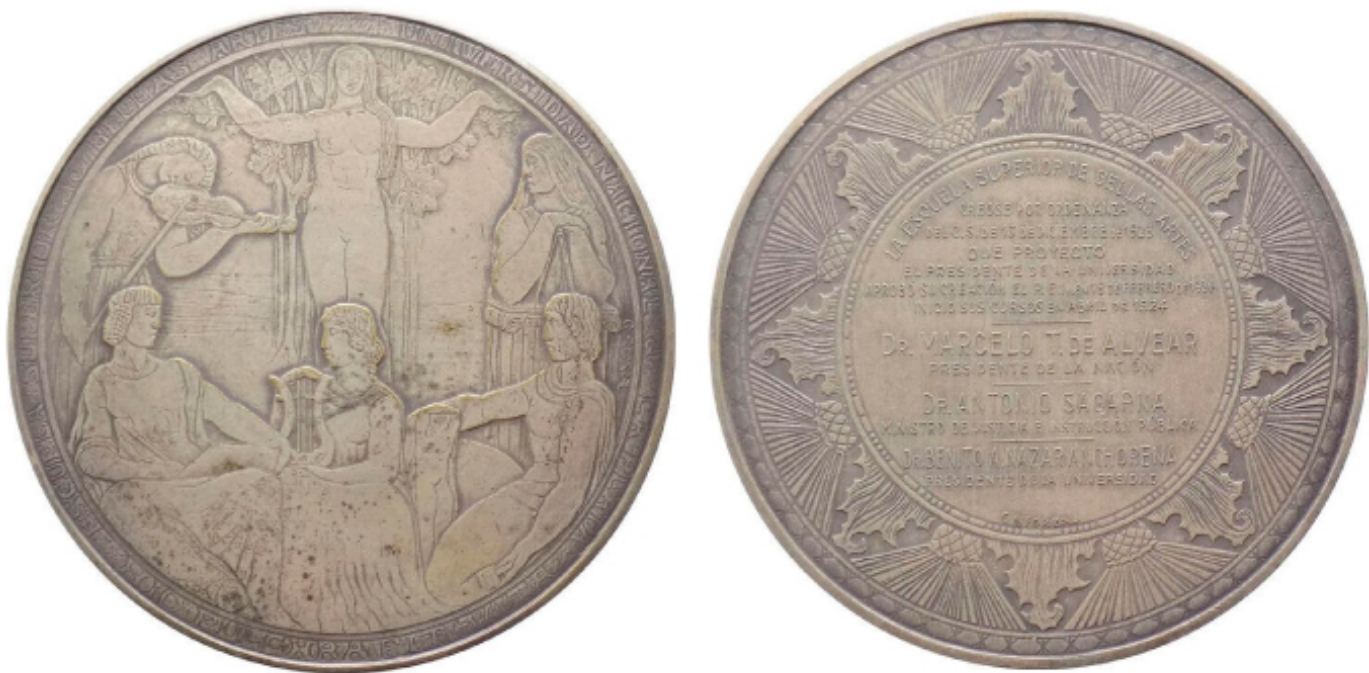
medalla conmemorativa de la creación de la ESBA Escuela Superior de Bellas Artes - UNLP - Hic pulchra fit vita - 1924 -