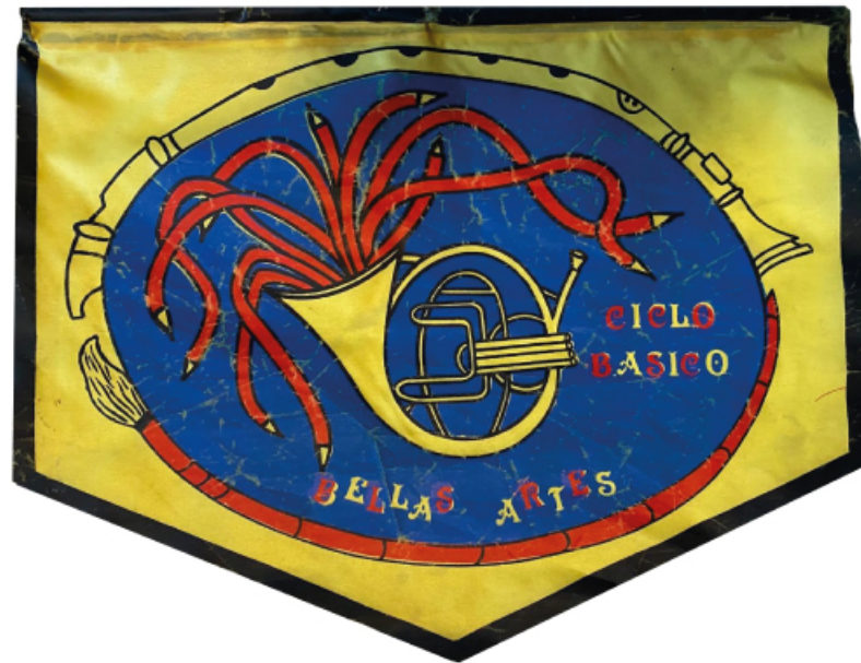
banderín Ciclo Básico diseñado por estudiante - 1990 -