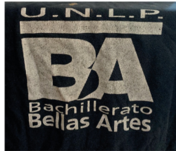
aplicación serigráfica de la marca en remera - frente y dorso - años 90s