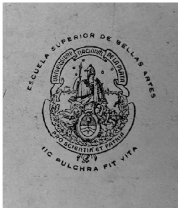
escudo de la UNLP con denominación y lema de la Escuela Superior de Bellas Artes - 1949 -