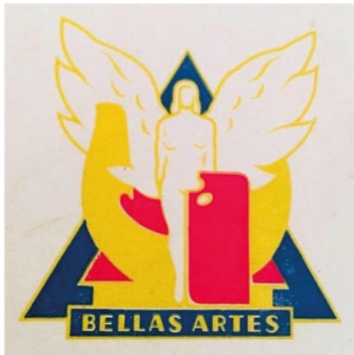
escudo revista IMAGEN - 1949 -