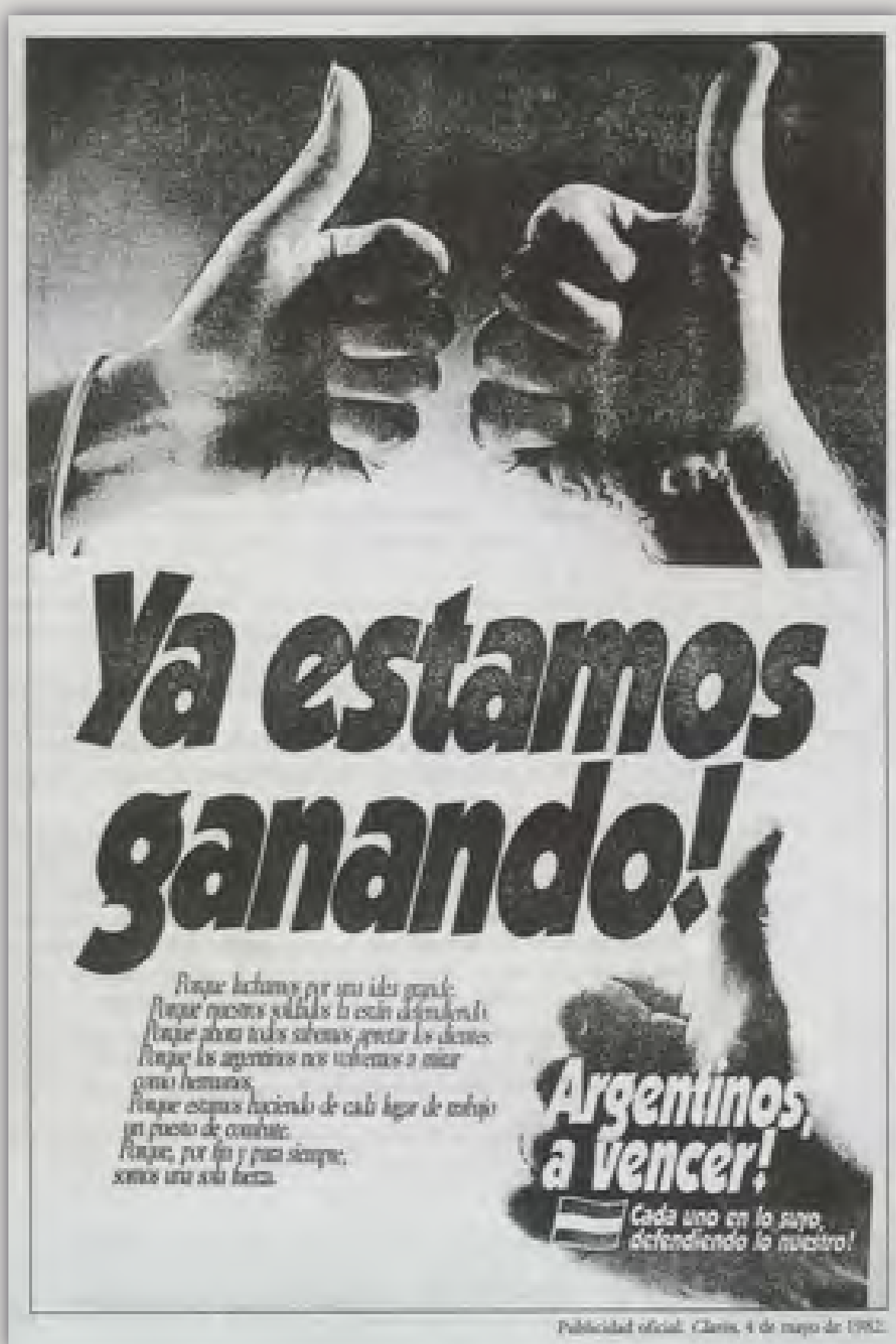
Publicidad oficial. Clarín, 4 de mayo de 1982.

Con estas palabras no pretendemos agotar todas las posibles inquietudes que suscita la conmemoración de este episodio de la historia de nuestro país. Somos conscientes de que muchas cuestiones importantes fueron soslayadas. Se trató tan sólo de una invitación para tener presente lo sucedido, para no olvidar lo que forma parte de nuestra identidad como pueblo.